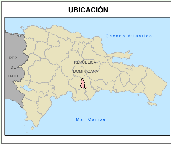
División Política Oficina Nacional de Estadísticas 2010